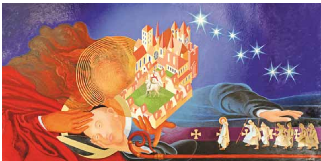
Hugues, évêque de Grenoble, voit en songe Bruno et ses compagnons. Tableau exposé à la Correrie tout l'été.