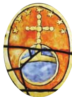
Détail d'un vitrail de l'église du Sappey-en-Chartreuse

La croix demeure tandis que le monde tourne