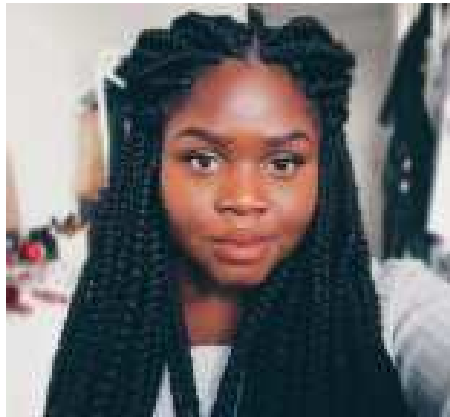
Mademoiselle Gloria Type : Humour / Lifestyle Cible : Collégiens