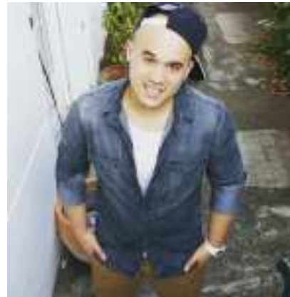
Renaud est différent Type : Humour Cible : Collégiens / Lycéens